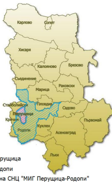
Карта на територията на МИГ „Перушица-Родопи“